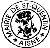
Pierre ANDRE Sénateur de l'Aisne Maire de Saint-Quentin